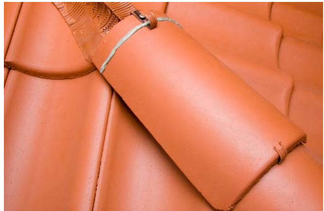
Bild 2. Nock med klammer

Material: Förzinkat stål Yta: Pulverlackerad Färg: Svart (20) tegelröd (24)